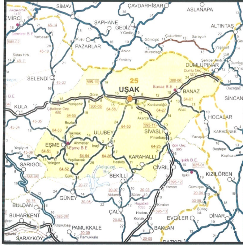
HARİTA 3: UŞAK İLİ KARAYOLLARI HARİTASI

Demiryolu: Afyon-Uşak-İzmir Demiryolu il merkezinden geçmekte olup il sınırları içindeki demiryolu uzunluğu 159 km'dir. 1897 yılından bu yana hizmet veren hat, hızlı tren projesi kapsamına alınmıştır.